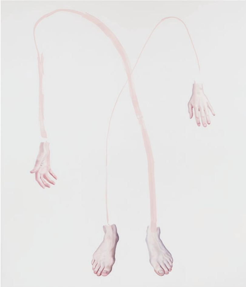
My Gleaming Soul, 210 x 180 cm, Öl auf Leinwand