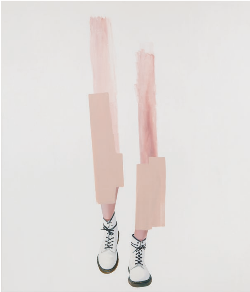
I am All Soul, 210 x 180 cm, Öl auf Leinwand