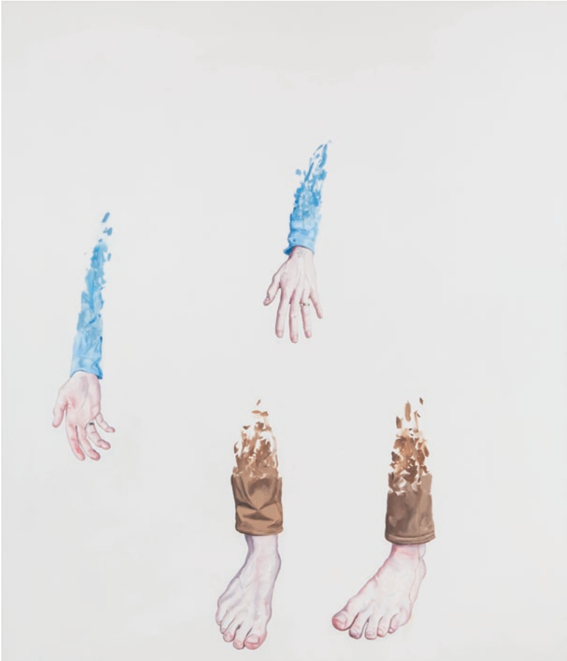
Song of Your Sailing Days, 210 x 180 cm, Öl auf Leinwand