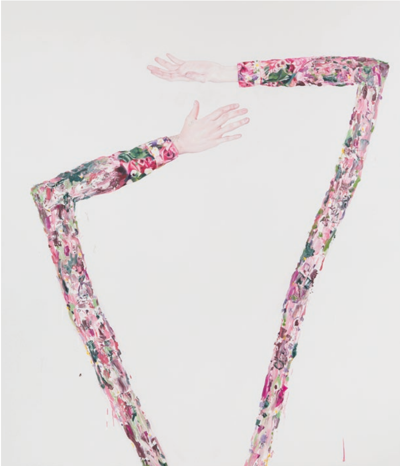
Glittering with Decay, 210 x 180 cm, Öl auf Leinwand