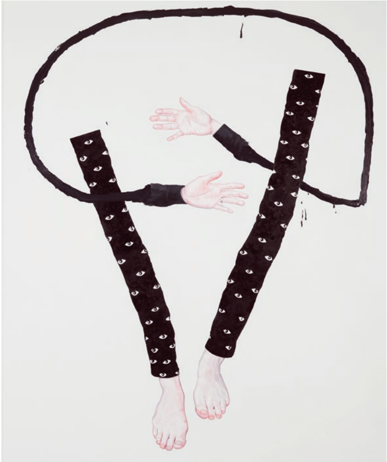
Hello Love, 210 x 175 cm, Öl auf Leinwand