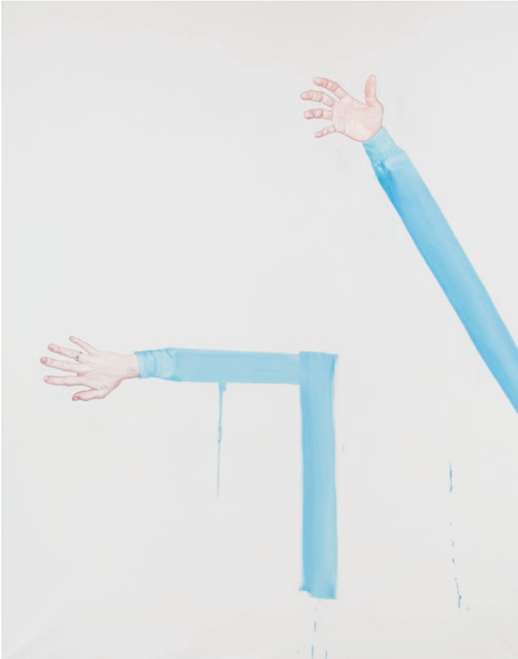
Milk, 210 x 165 cm, Öl auf Leinwand