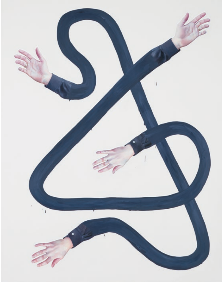
Your Face Just Like the Devil, 210 x 165 cm, Öl auf Leinwand