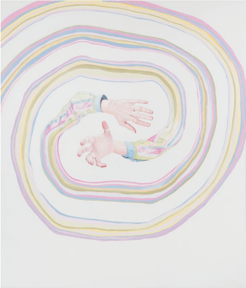
Follow Me, I Know Everything, 210 x 180 cm, Öl auf Leinwand