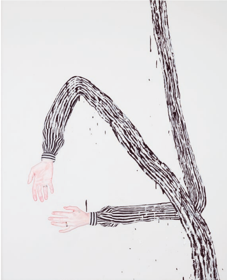
No Pain at All, 210 x 170 cm, Öl auf Leinwand